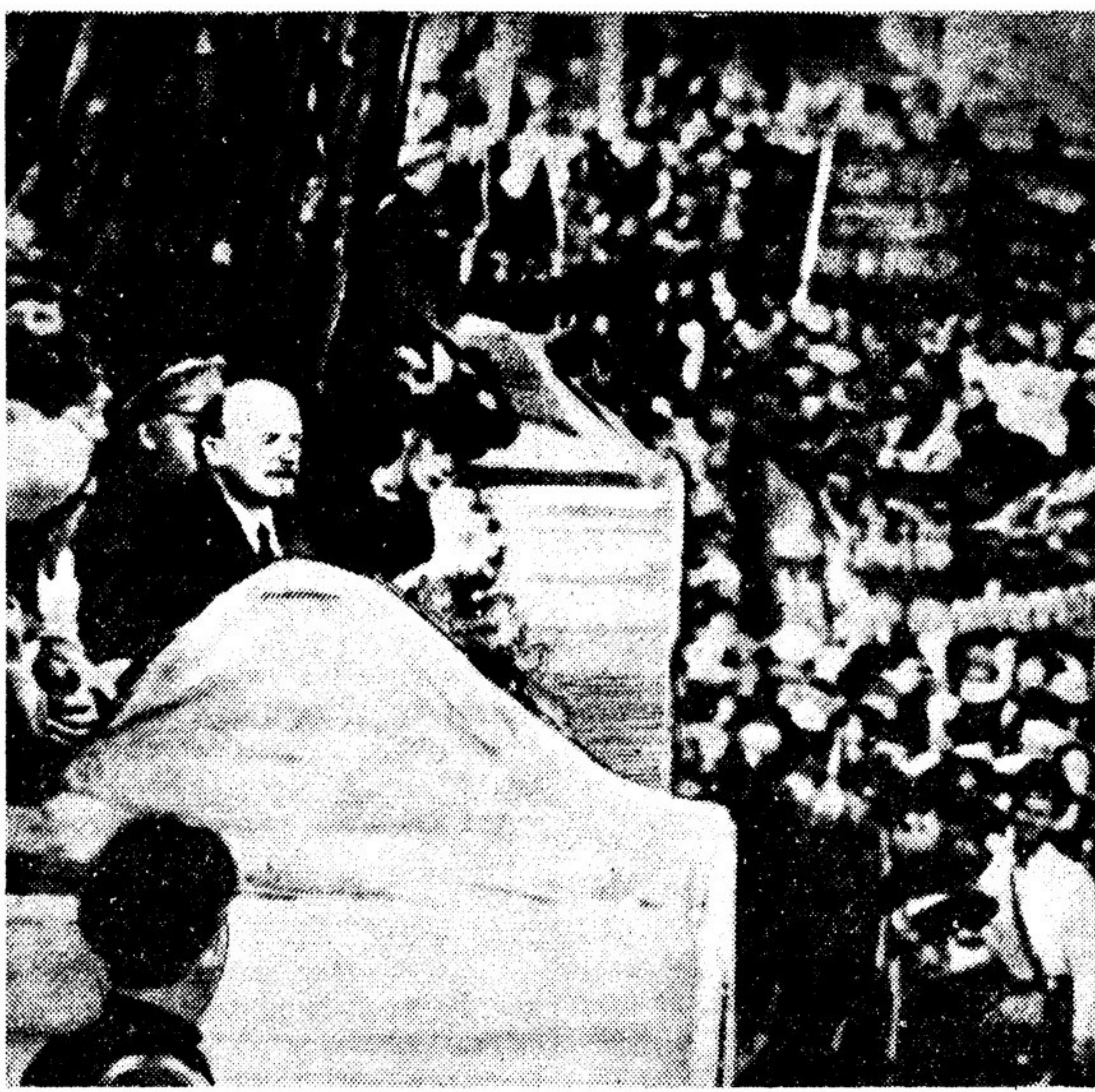
В. И. ЛЕНИН ПРОИЗНОСИТ РЕЧЬ НА ПЛОЩАДИ УРИЦКОГО В ПЕТРОГРАДЕ

Отдавая дань благодарности Ленину, поэзия народов сделала лишь первые шаги. Возможности воздать ему должное, открывавшееся перед писателями и поэтами нашего и грядущих поколений, поистине необозримы. Ибо в каждом крупном достижении, которое способствует движению человечества вперед, всегда, пусть незримо, живет великий дух Ленина.