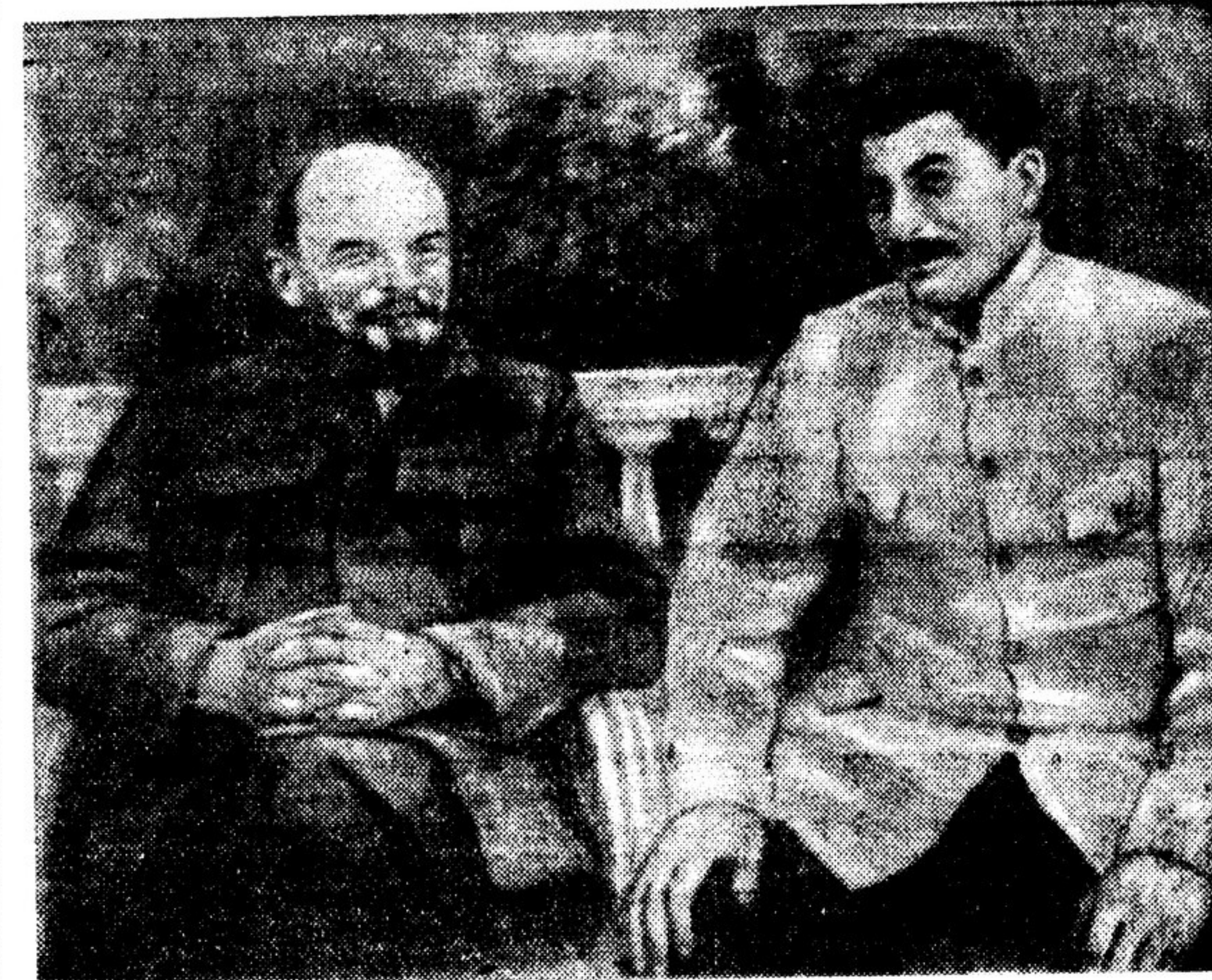
В. И. ЛЕНИН И И. В. СТАЛИН В ГОРКАХ.